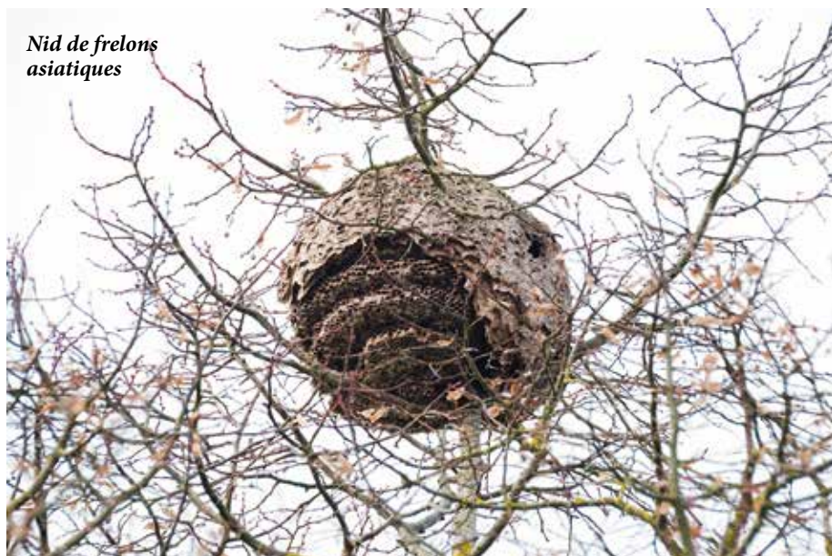
Nid de frelons asiatiques

Face à la multiplication des frelons asiatiques sur le territoire, la mairie d'Ermont accorde une aide aux particuliers pour participer au financement de la destruction des nids.