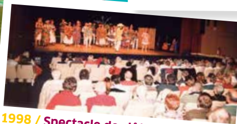
1998 / Spectacle de clôture au Théâtre Pierre-Fresnay

RETROUVEZ TOUTES LES ANIMATIONS PROPOSÉES JUSQU'AU 9 DÉCEMBRE SUR ERMONT.FR