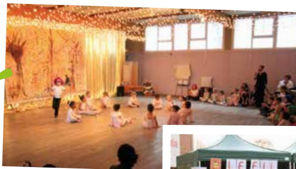
2012 / Spectacle de l'AEC