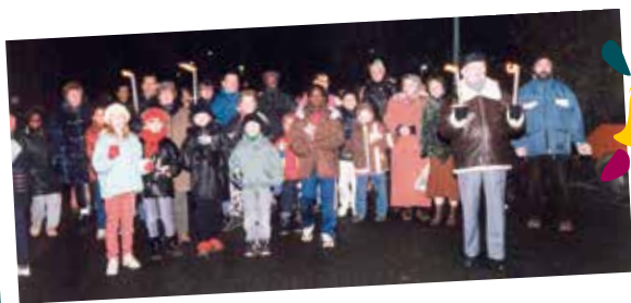
1998 / Défilé de chandelles

PLUS D'INFOS SUR LA PAGE FACEBOOK : HTTPS://WWW.FACEBOOK.COM/TELETHONERMONT/