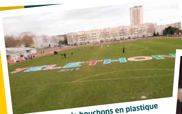
2017 / Collecte de bouchons en plastique