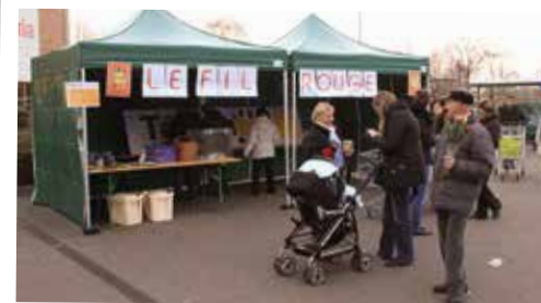
2014 / Le fil rouge à Cora