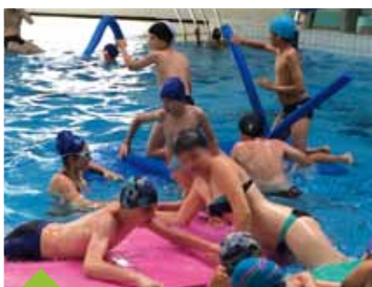
VEILLÉES THÉMATIQUES POUR LES CM2