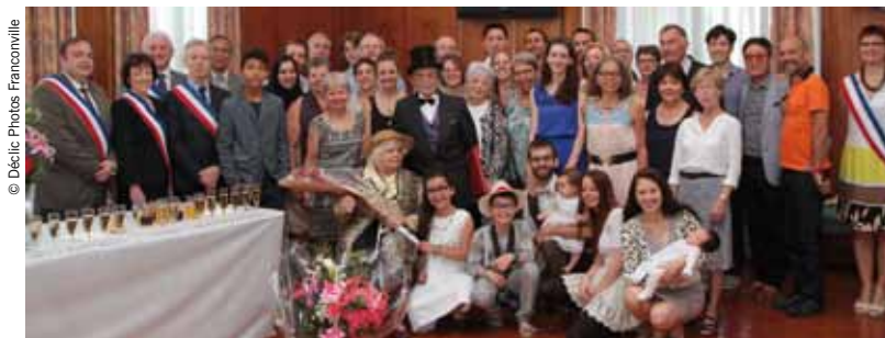
Les noces de platine de Monsieur et Madame Prost