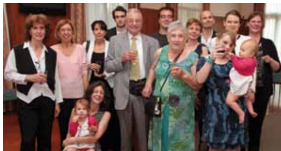
Les noces de diamant de Monsieur et Madame Paris